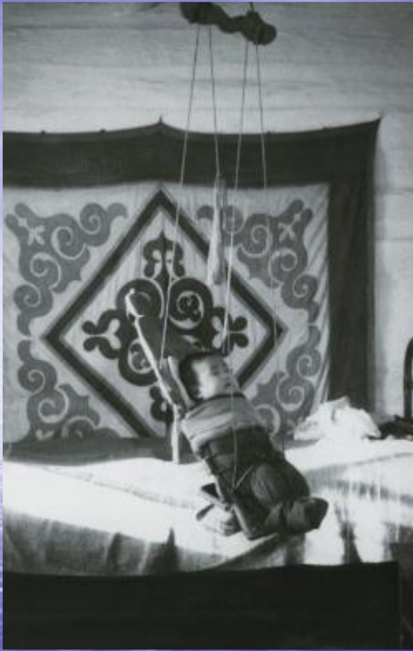
Колыбель нивхского типа выдолблена из куска дерева