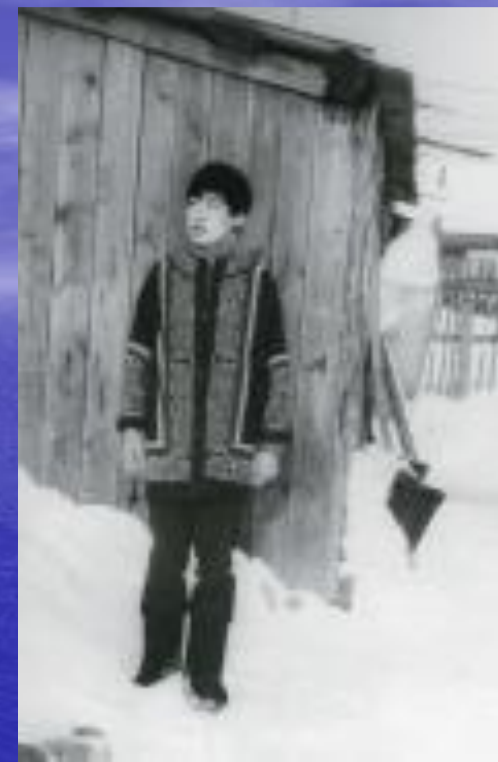
Традиционная мужская куртка