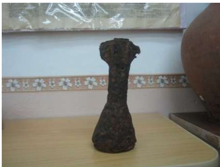
Осколок от снаряда