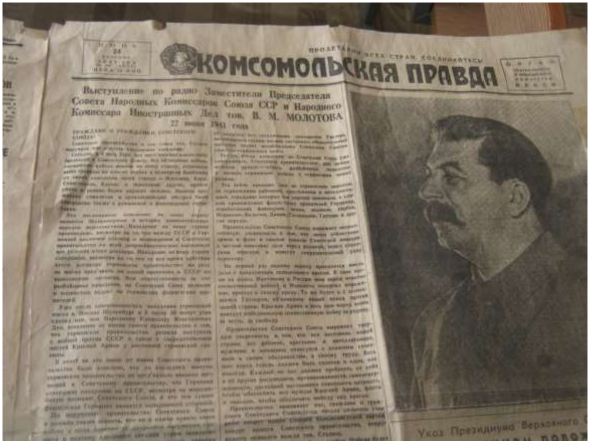
Документы из архива г.Подольска.