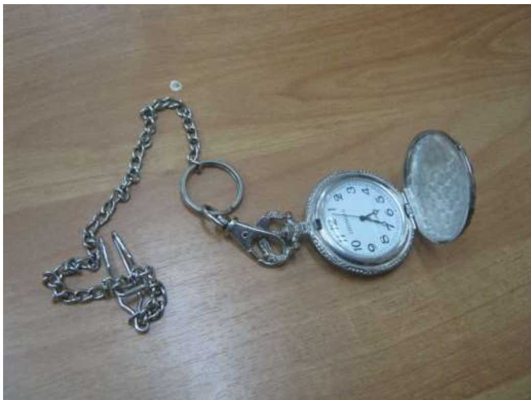
Часы участника войны, полученные за проявленное мужество в боях.