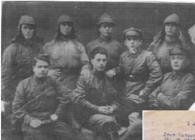
(в центре сидит) Участник войны с милитаристской Японией. Фото 1944года.