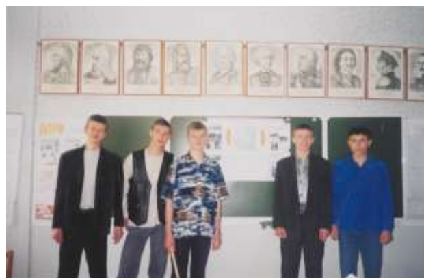
Участники научно-практической конференции.