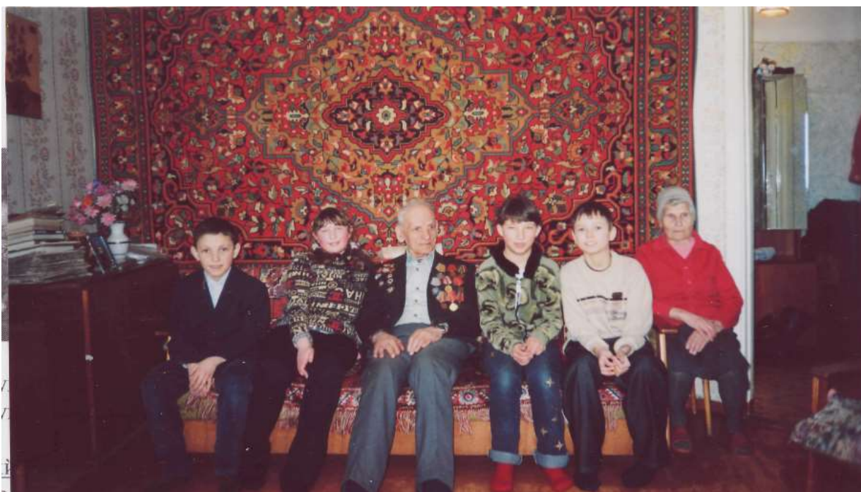
В гостях у ветерана участники поискового отряда Сергеевской школы.