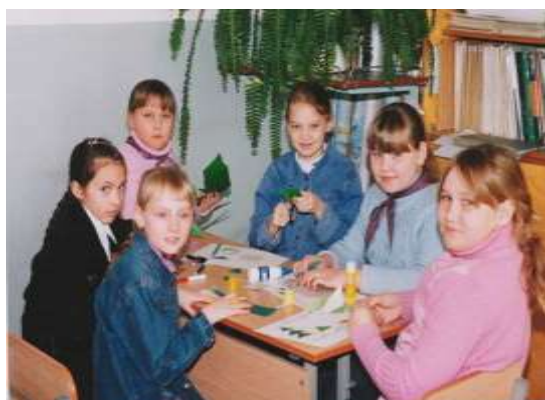
Участники историко – краеведческого объединения «Русичи»