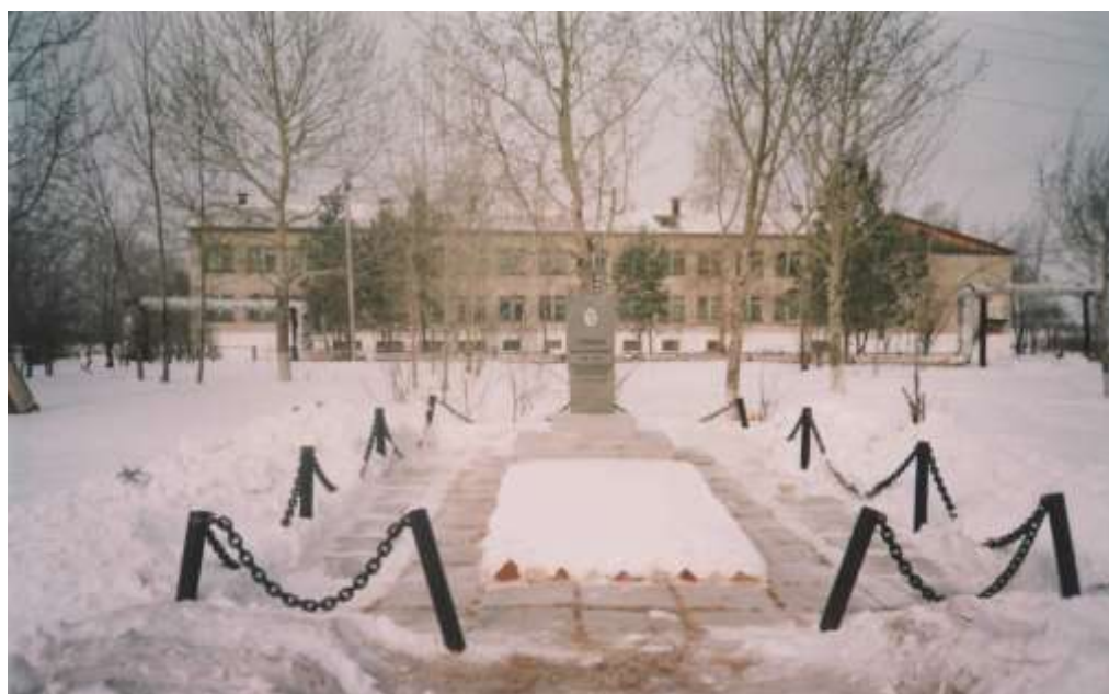
Памятник герою – односельчанину Громыко А.Е., погибшему в годы гражданской войны на Дальнем Востоке.