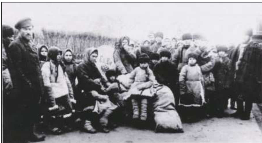
На фото первые переселенцы.