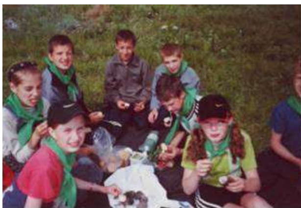
Юные экологи школы.