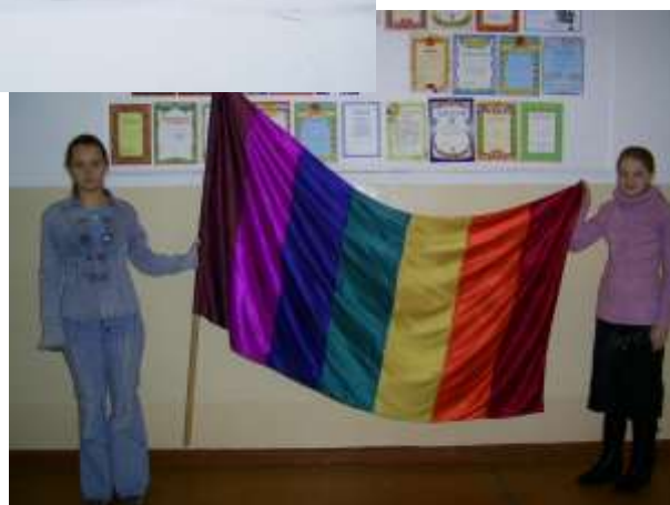
Флаг детского объединения «Радужная страна»