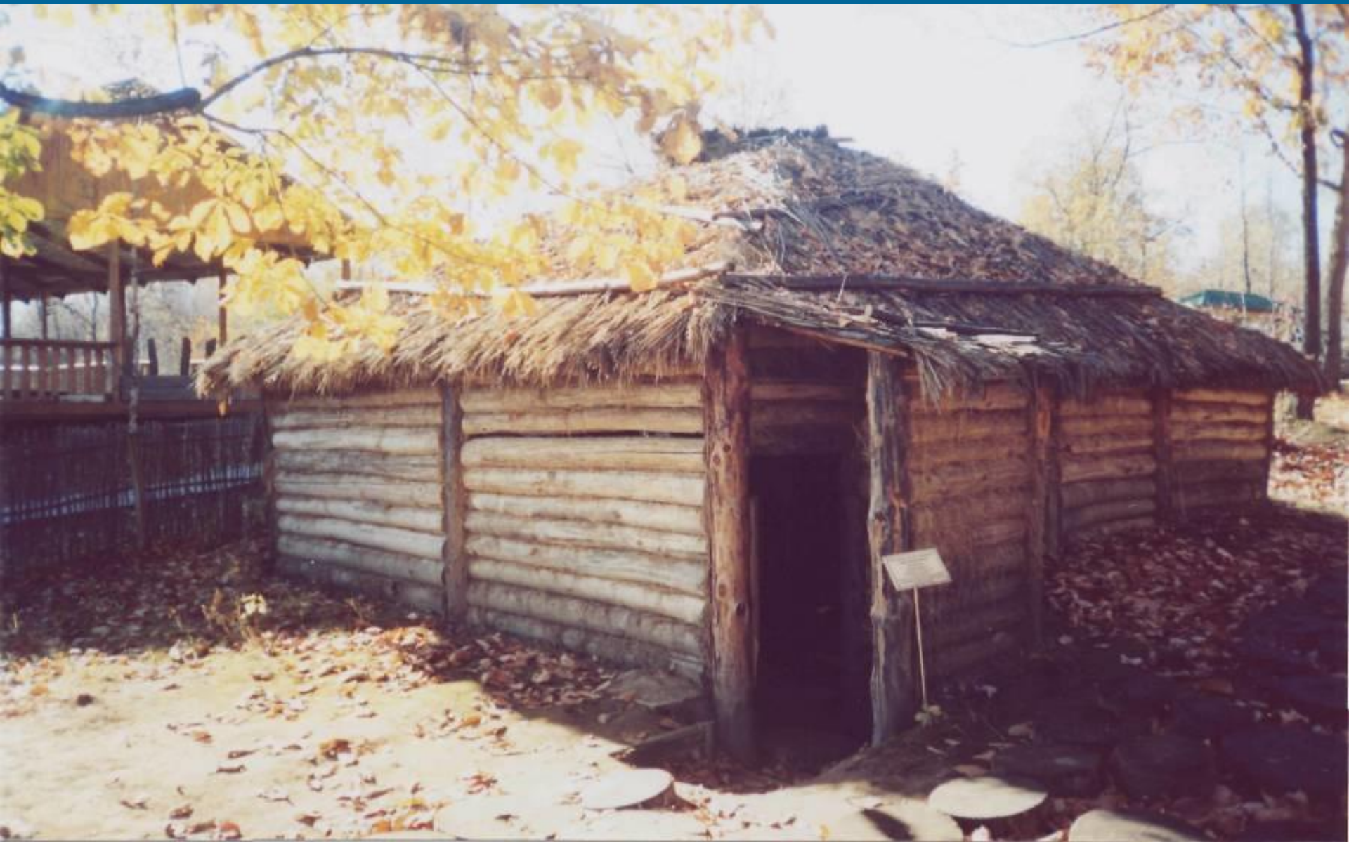
Наземное жилище (железный век)