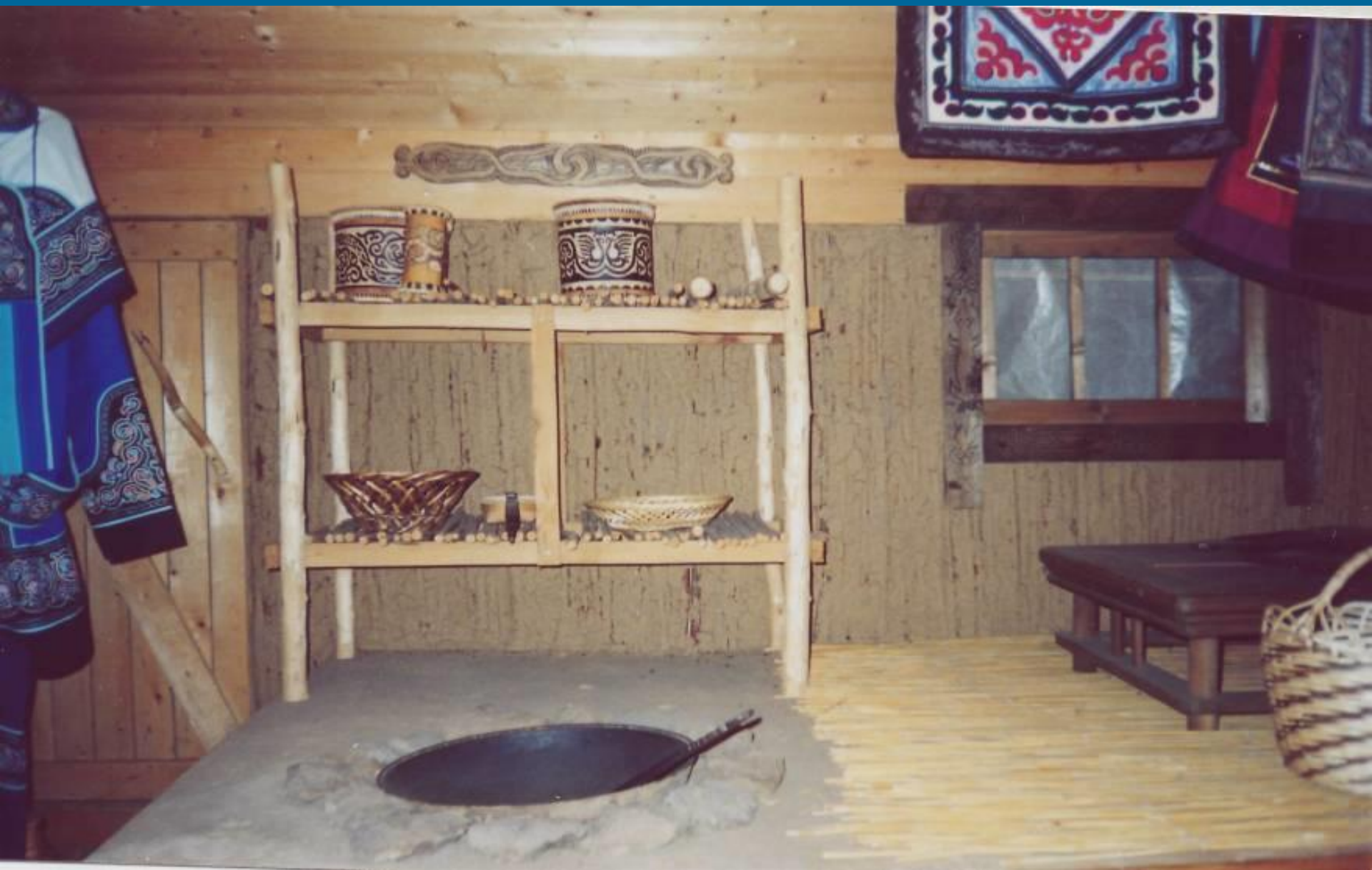
Жилище коренных народов Амура.