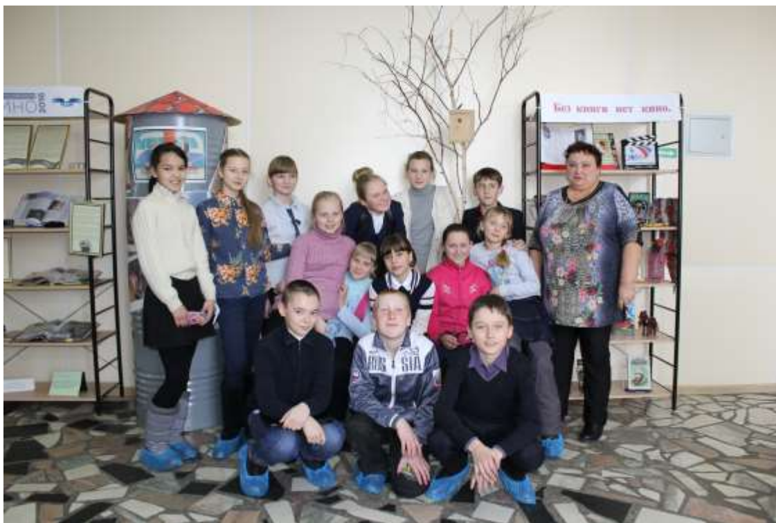
Фото на память.