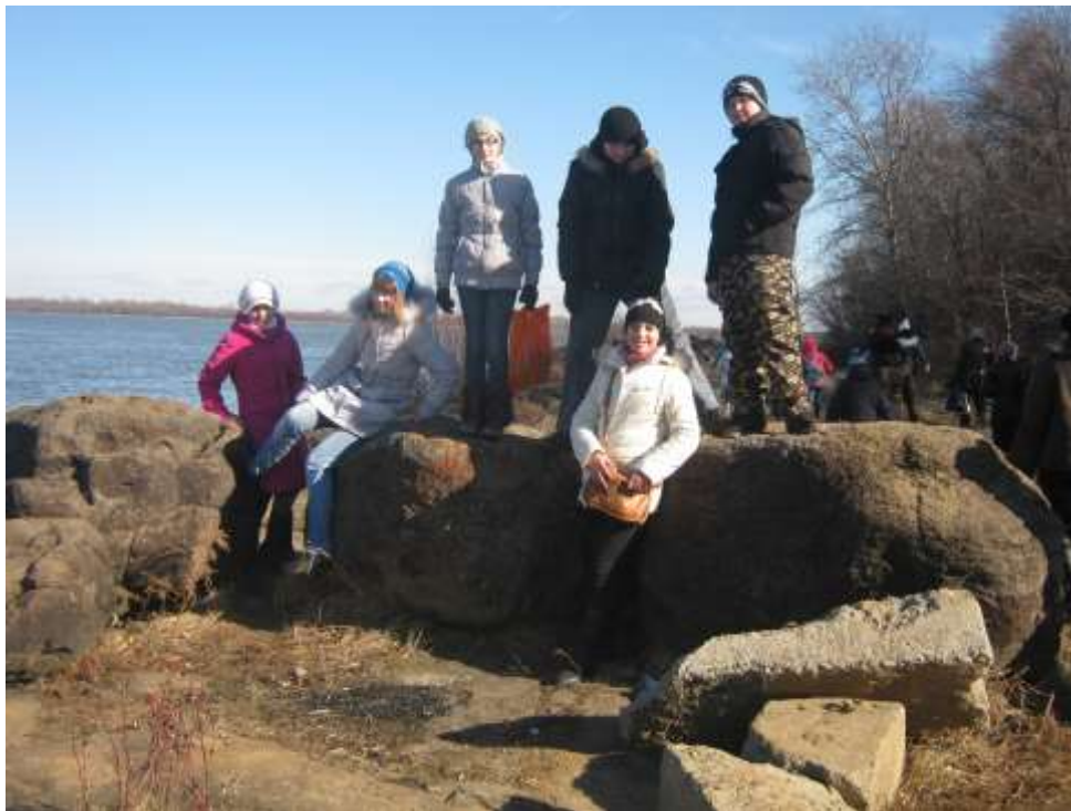
Знаменитые валуны с петроглифами.