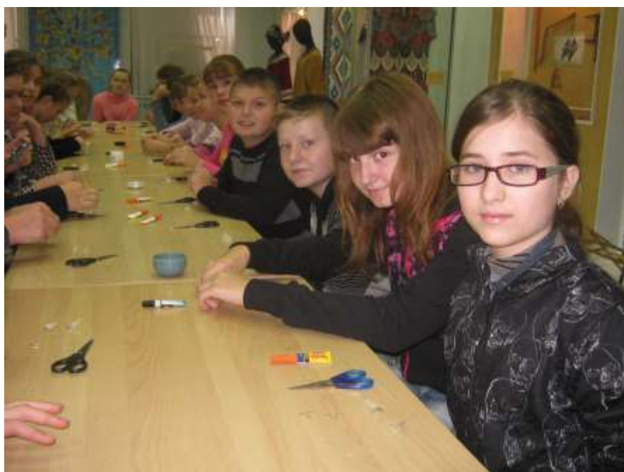
Изготовление сережек из рыбьей кожи и чешуи