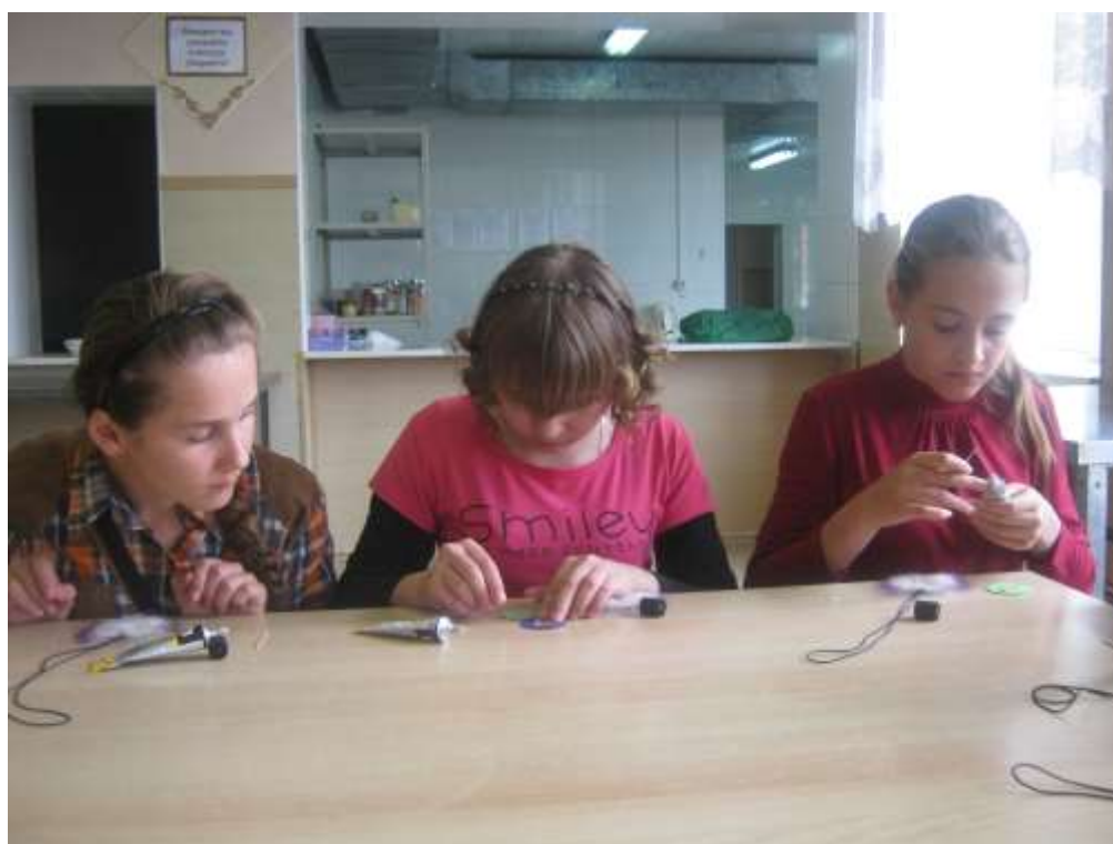
. Изготовление нанайских амулетов-оберегов.