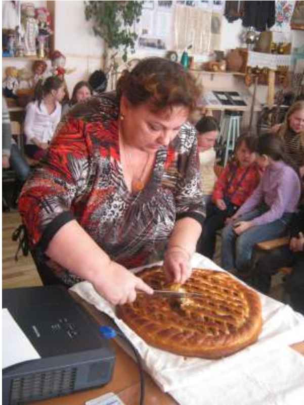
Посиделки за самоваром