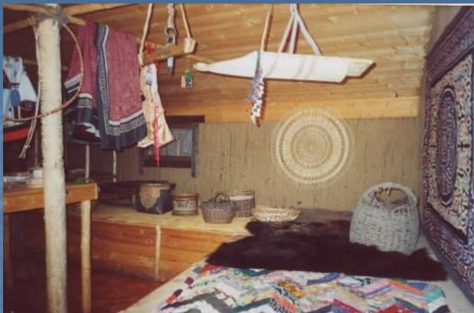
Внутреннее убранство жилища древних амурцев.