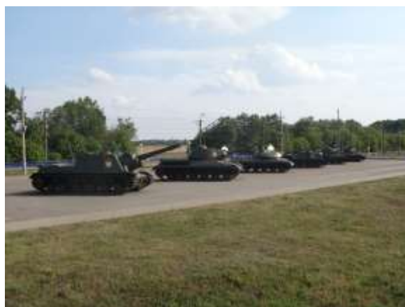
Панорама Прохоровского мемориала