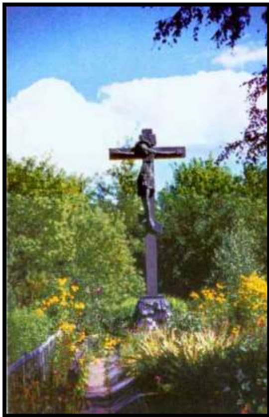
Захоронение воинов, погибших в Прохоровской битве с.Сторожевое